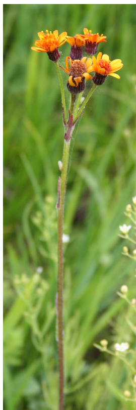
Senecio besseranum Minder.